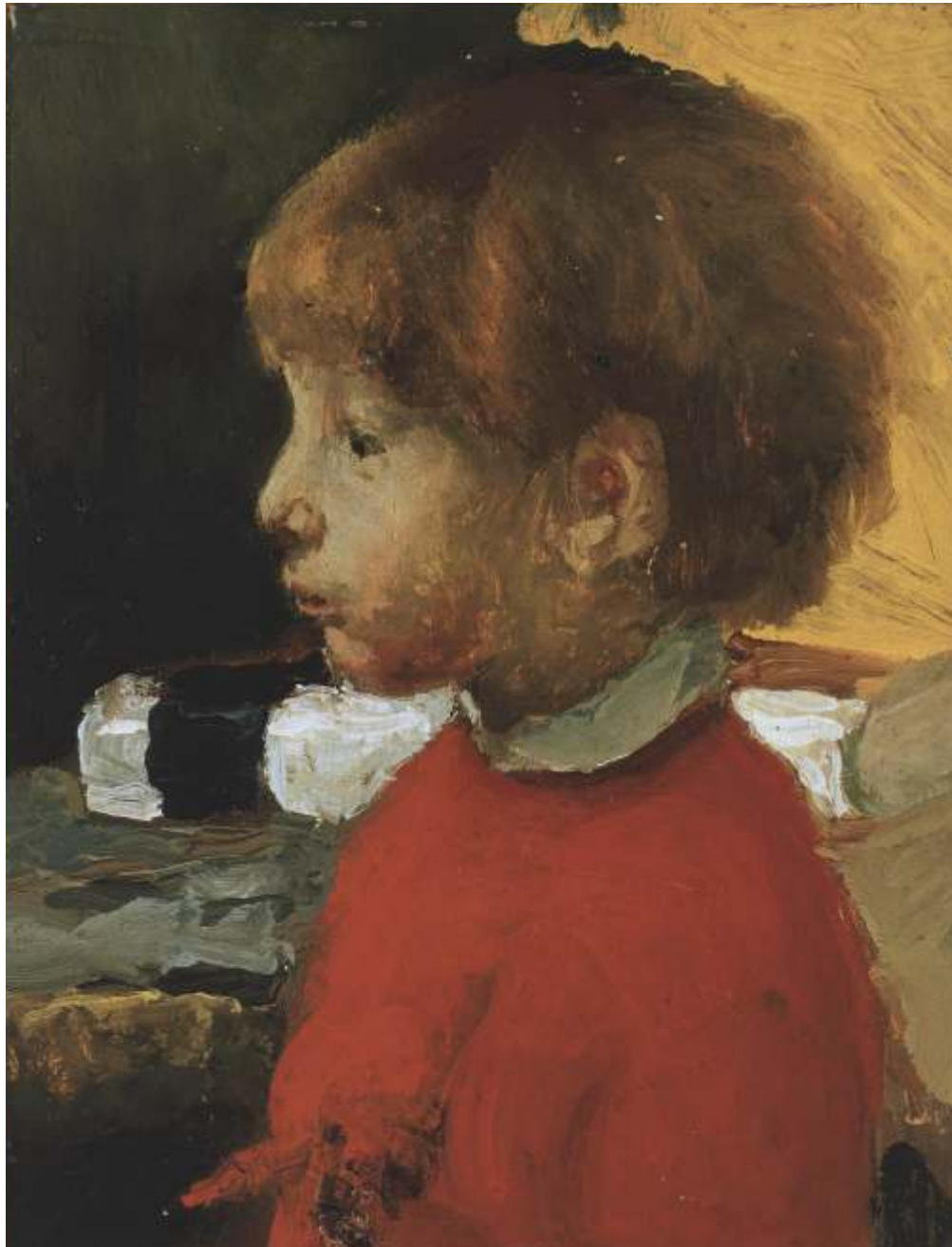
Eppe di profilo, 1962 Olio su tavola - cm 26x17 Venezia, Collezione privata