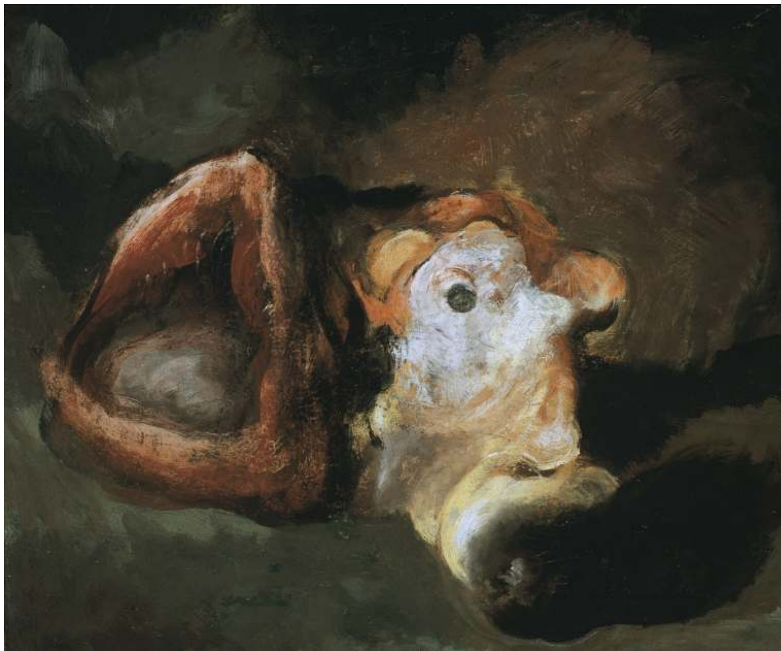
Testa di vitello con testa di pesce, 1989