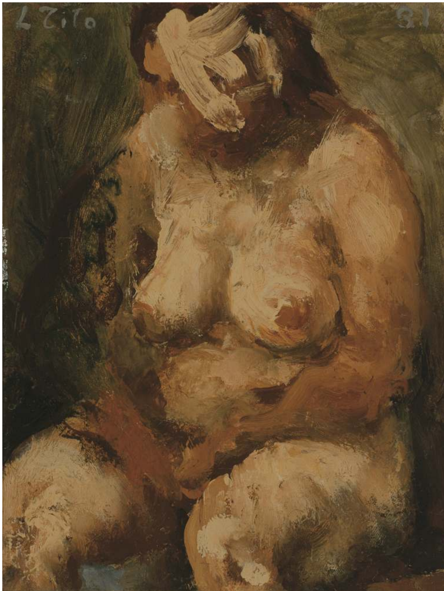
Nudo, 1981 Olio su tavola - cm 20x15 Venezia, Collezione privata