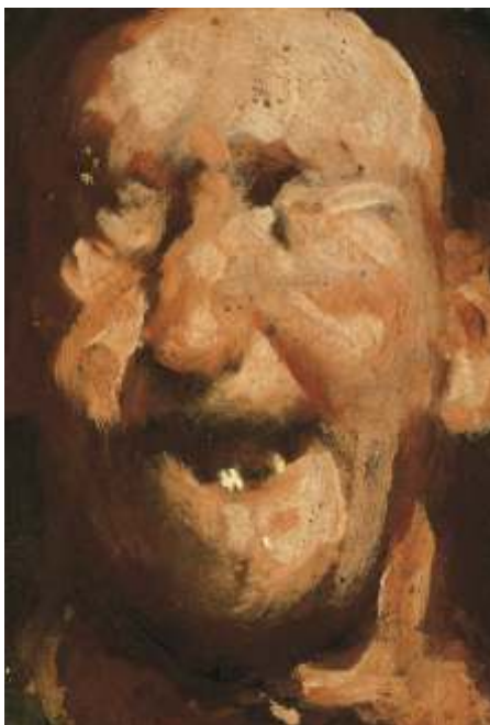
Vecchio sdentato, 1990 Olio su tavola - cm 26x18 Venezia, Collezione privata