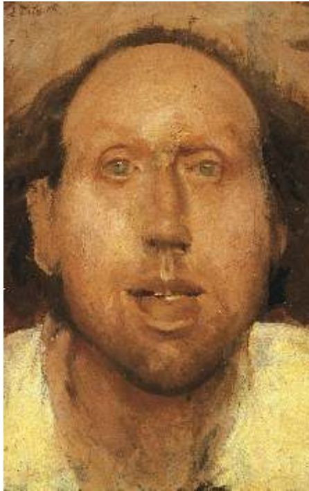
Ritratto del pittore Ellero, 1976 Olio su compensato - cm 26x17 Venezia, Collezione privata