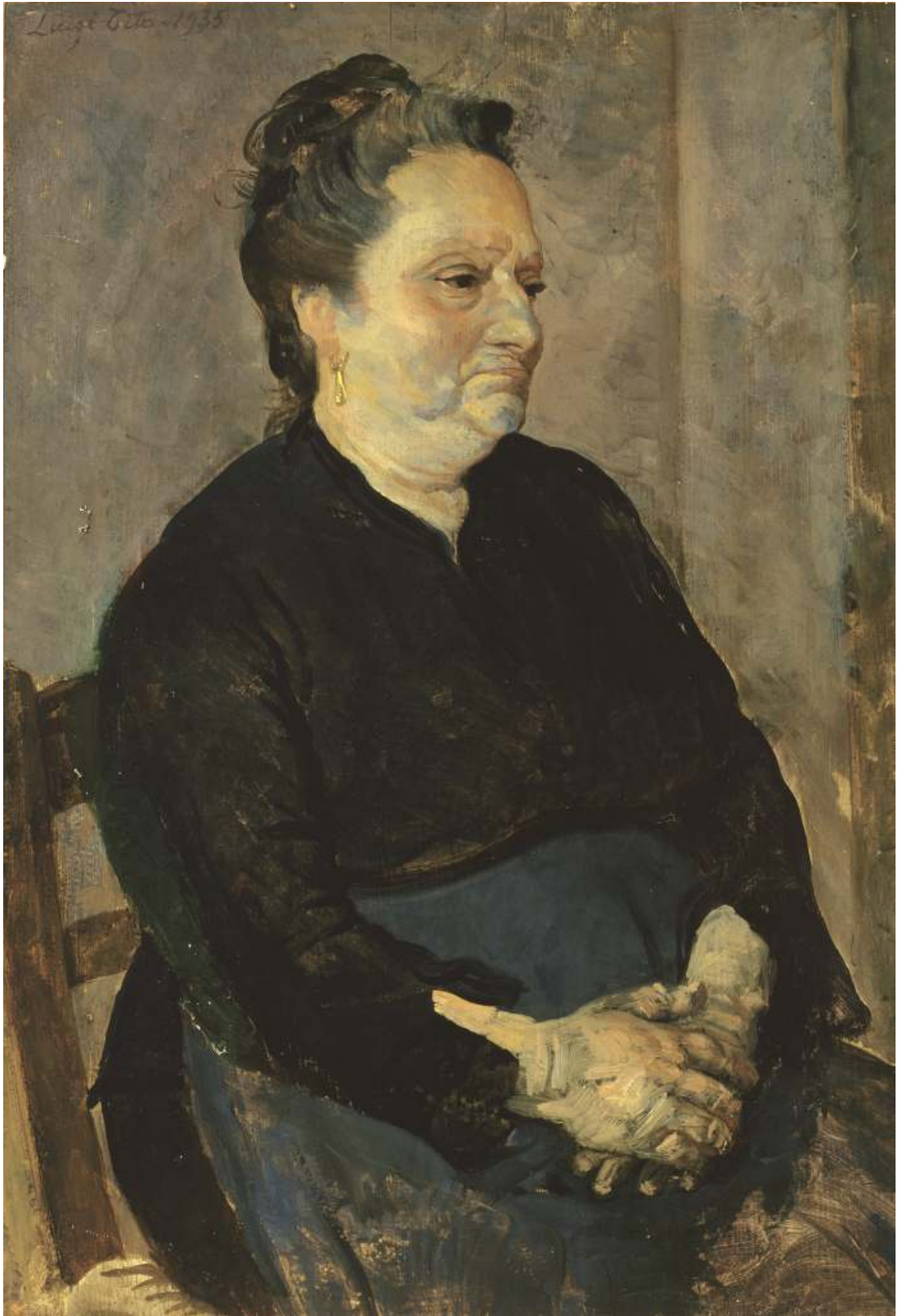
La Gigia, 1935 Olio su tavola - cm 49,5x35 Venezia, Collezione privata