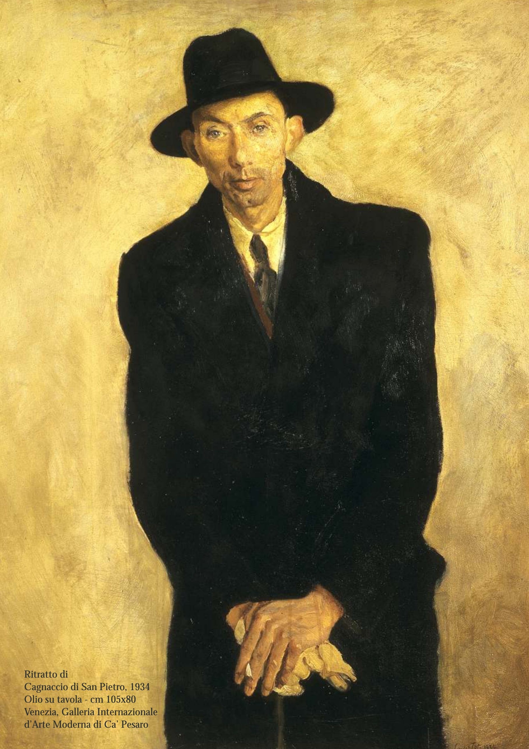
Ritratto di Cagnaccio di San Pietro, 1934 Olio su tavola - cm 105x80 Venezia, Galleria Internazionale d'Arte Moderna di Ca' Pesaro