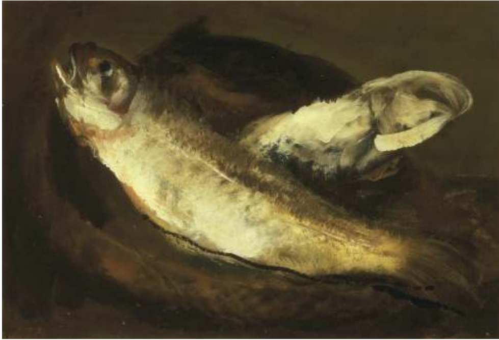
Due trote su fondo grigio verde, 1983 Olio su carta riportata su tavola - cm 51x75,5 Venezia, Collezione privata