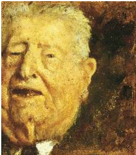
Ritratto del Conte Avogadro, 1983 Olio su tela - cm 44x39 Venezia, Collezione privata