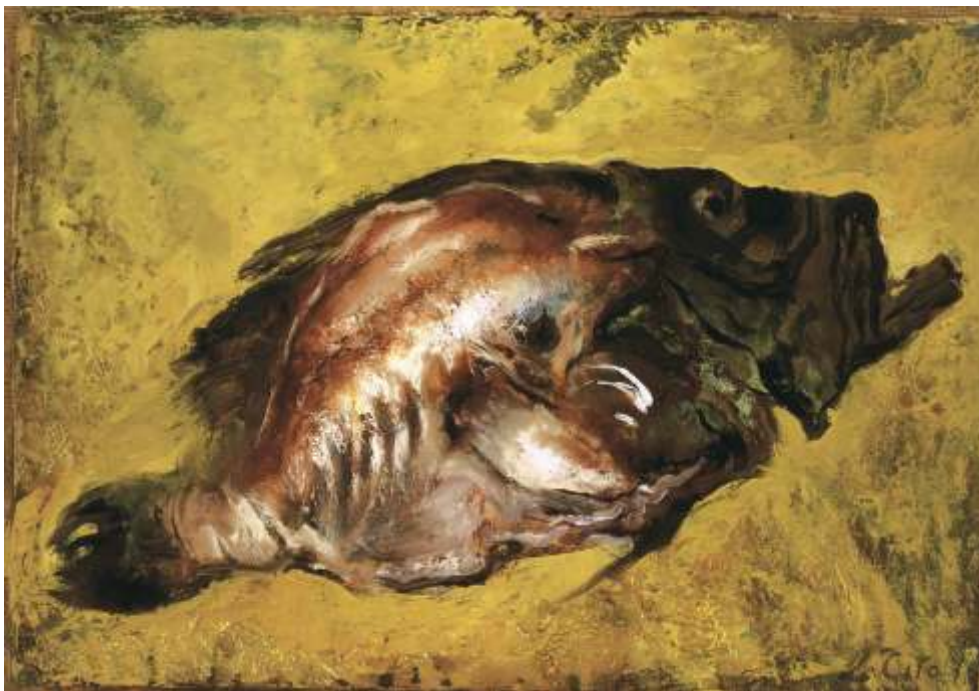
Pesce San Pietro su fondo giallo, 1978 Olio su carta riportata su tela - cm 39x53 Venezia, Collezione privata