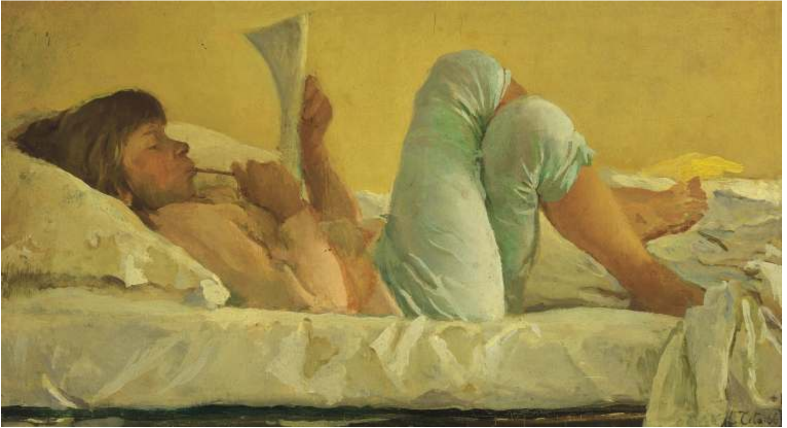
Lucia che legge, 1966 Olio su tavola - cm 19x33 Venezia, Collezione privata