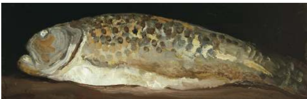
Trota, 1982 Olio su carta riportata su tavola - cm 23,5x71,5 Venezia, Collezione privata