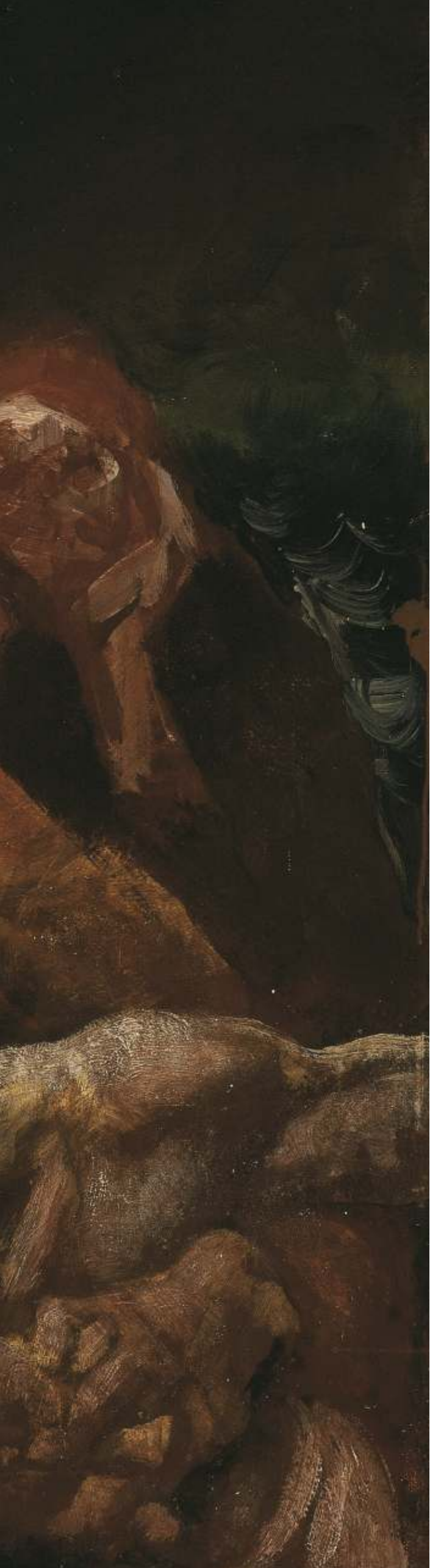
Vescovo giallo, 1982 Olio su carta riportata su tela - cm 123x128 Venezia, Collezione privata