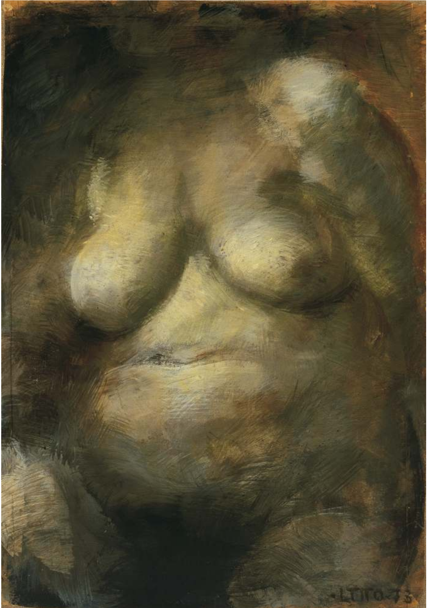
Nudo, 1973 Olio su carta riportata su tela - cm 100x70 Venezia, Collezione privata