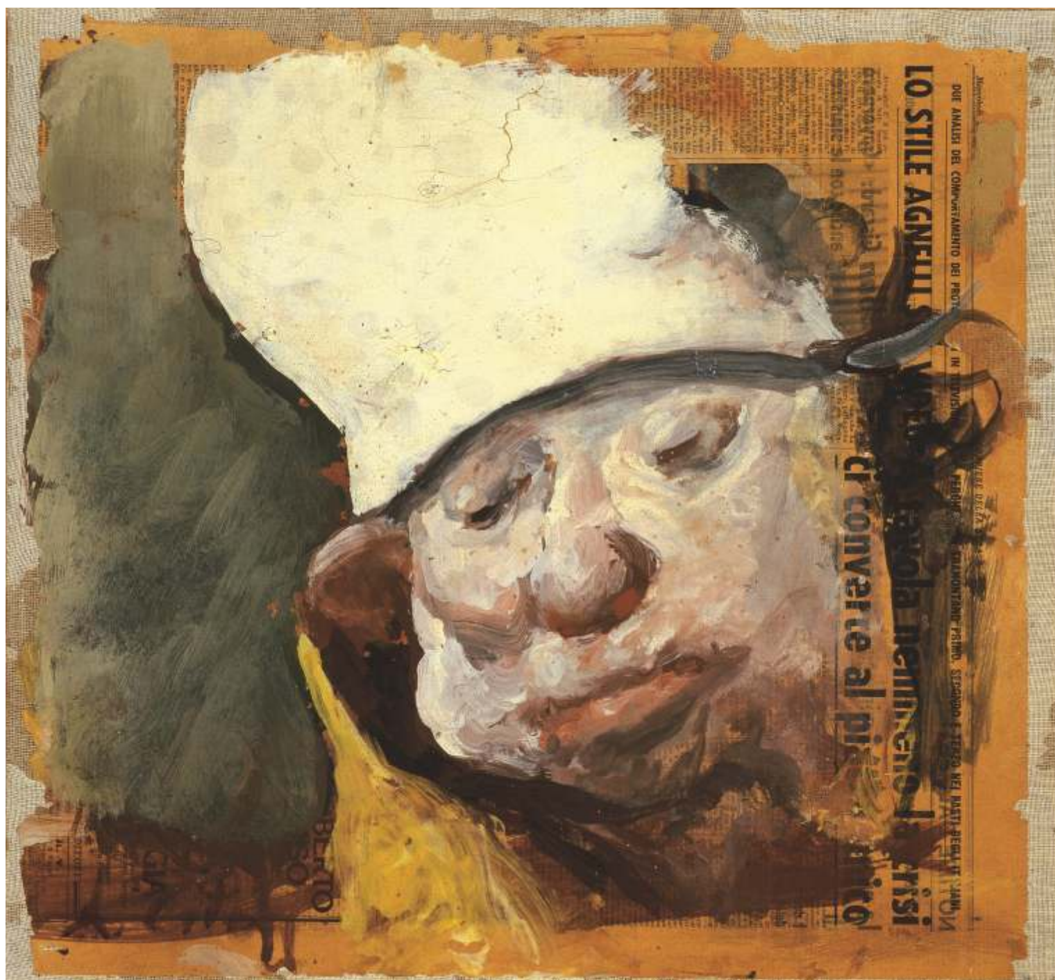
Testa di vescovo, 1983 Tempera su carta di giornale riportata su tela - cm 46x49 Venezia, Collezione privata