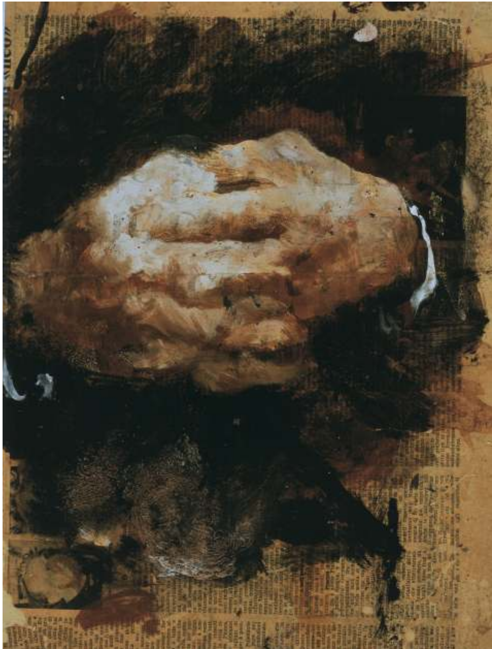
Mani del Conte Avogadro, 1989 Tempera su carta di giornale riportata su tavola - cm 40x30 Venezia, Collezione privata