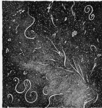
Pelagoduecentosette, 2011 Matita e inchiostro nero su carta, 35x35 cm