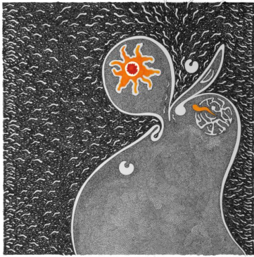
Pelagocentottantasei, 2010 Tecnica mista su carta ,35x35 cm Collezione Gillo Dorfles