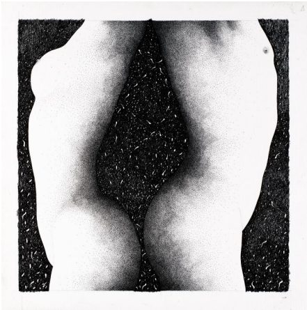
Francesca e Paolo (Inferno canto v ), 2003 Matita e inchiostro nero su carta, 34,8x35 cm