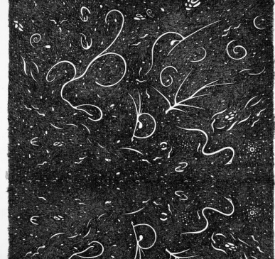
Pelagoduecentonove, 2012 Matita e inchiostro nero su carta, 35x35 cm