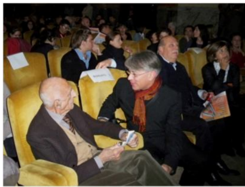
Gillo Dorfles con Donato Di Zio al Festival della creatività, Cinema Odeon, Firenze, 2010