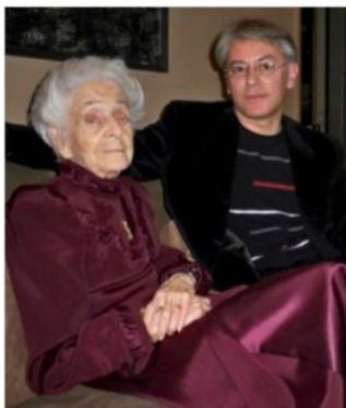
Rita Levi- Montalcini con Donato Di Zio, Roma 2009

Dal 15 settembre al 15 dicembre 2012 una nuova mostra dell'artista è ospitata negli spazi della prestigiosa Biblioteca Marucelliana di Firenze, con opere legate sia alla nuova produzione sia di periodi diversi, anche giovanili e del periodo liceale e accademico, per lo più inedite e pubblicate per la prima volta in questo nuovo volume. La mostra alla Biblioteca Marucelliana è arricchita dalla pubblicazione di questo nuovo catalogo a cura Gillo Dorfles.