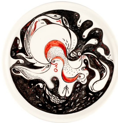
Schegge da Pelago n. 11, 2011 Piatto in porcellana, pezzo unico, diam.35 cm Collezione Gillo Dorfles